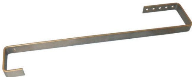
Schrägdach Montage-Set - Dachziegel