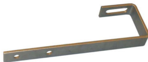
Schrägdach Montage-Set – flache Abdeckung